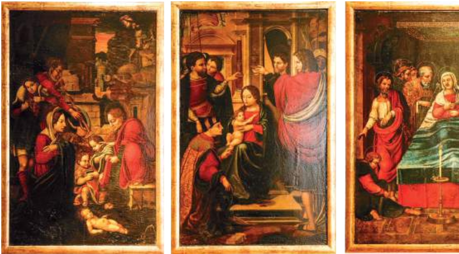
Fig. 1-b.- Maestro de Alcira, tabla de la Adoración de los pastores , Retablo de Los Gozos de la Virgen , Capilla de las Escuelas Pías, Gandía (procedente de la iglesia del convento de San Agustín, Alcira).