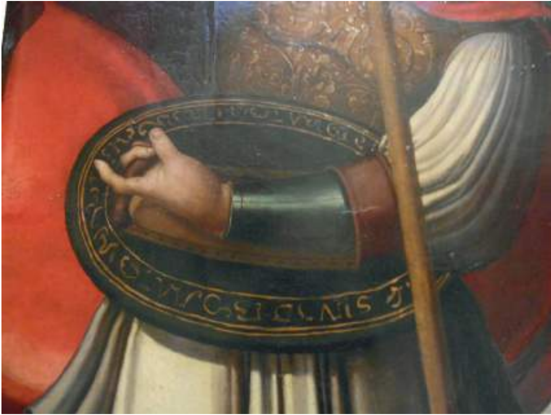
Fig. 2.- Maestro de Alcira, San Miguel (detalle del escudo), Museo de Bellas Artes, Valencia.

brocados en oro y el uso de arquitecturas decorativas; aunque reconoció una importante carencia cuanto a los rostros. 46 Basándose en las influencias de su producción, Albi explicó que se trataría de un pintor español que habría iniciado su formación en Valencia en el taller del Maestro de Cabanyes, 47 y posteriormente, en torno al 1520, habría realizado un viaje por Ita-