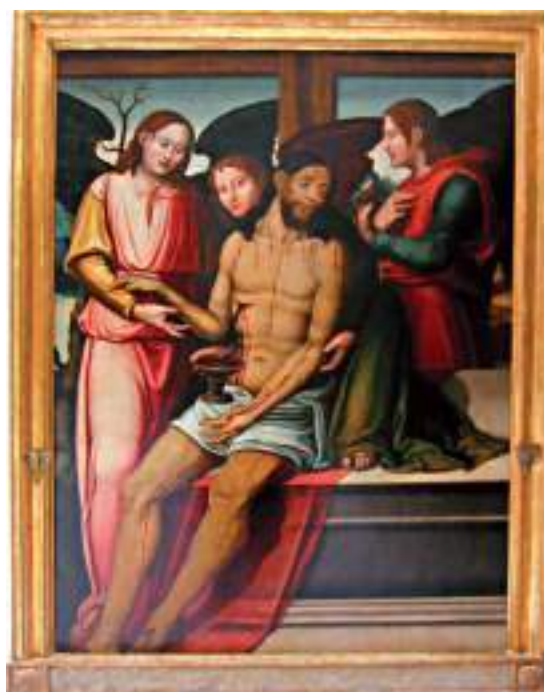
Fig. 3.- Maestro de Alcira, Cristo muerto sostenido por tres ángeles, Museo de Bellas Artes, Valencia.