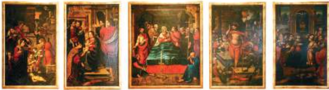
Fig. 1.- Maestro de Alcira, Retablo de Los Gozos de la Virgen , Capilla de las Escuelas Pías, Gandía (procedente de la iglesia del convento de San Agustín, Alcira) (Fotografía: Isabel Ruiz Garnelo, realizada por Odani Fotografía).

florentinos, 6 del veneciano Giovanni Bellini (1433-1516), 7 de diversas estampas romanas 8 y del ciclo de la Vida de la Virgen de Albrecht Dürer (1471-1528). 9 Otros han remarcado, más bien, su filiación con Vicent Macip (h. 1470-1551) 10 y, en menor medida, con Paolo da San Leocadio (1447-1519) 11 y Sebastiano del Piombo (1485-1547). 12