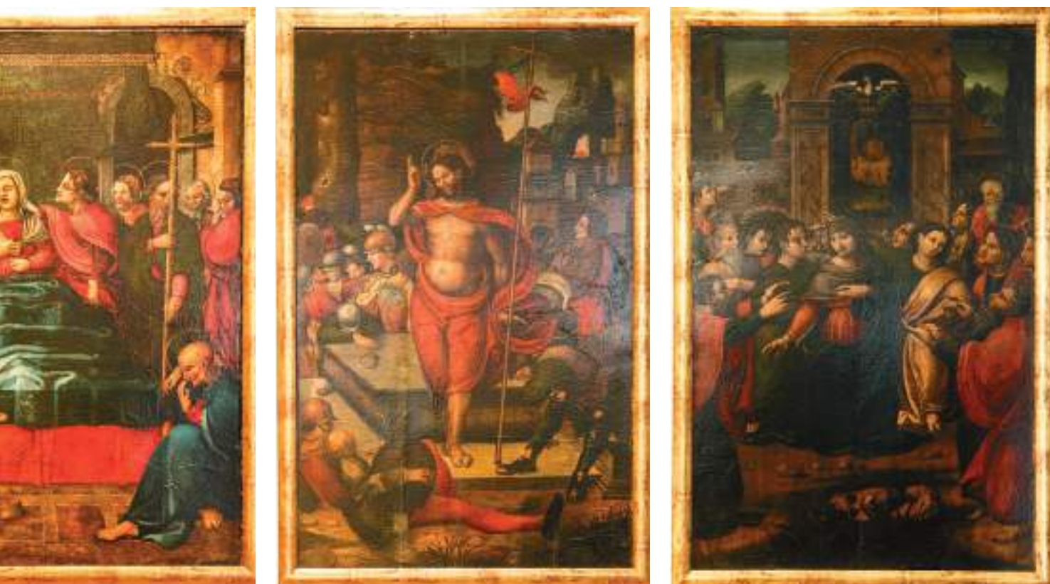
Fig. 1-d.- Maestro de Alcira, tabla de la Dormición de la Virgen , Capilla de las Escuelas Pías, Gandía (procedente de la iglesia del convento de San Agustín, Alcira).